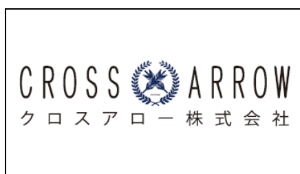
クロスアロー株式会社 様