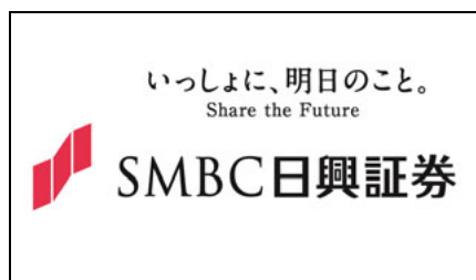
SMBC日興証券株式会社 様