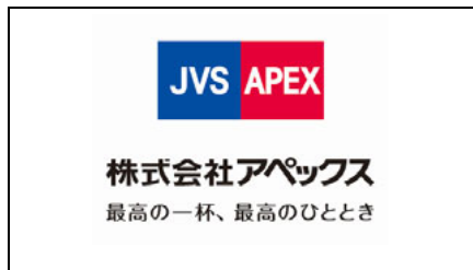
株式会社 アペックス 様